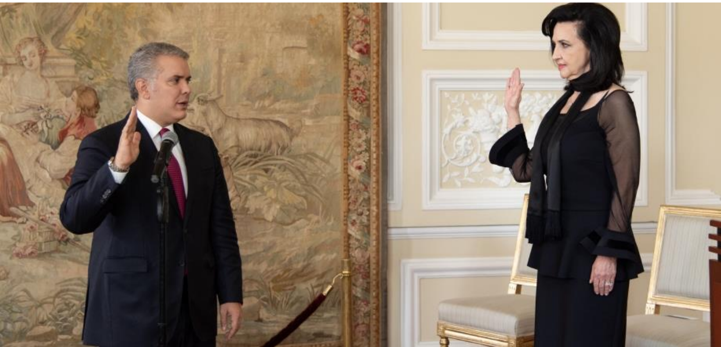
CLAUDIA BLUM DE BARBERI

La Ministra de Relaciones Exteriores, Claudia Blum, nació en Cali, Colombia. Es Licenciada en Consejería Psicológica de la Universidad del Valle y Magíster en Estudios Políticos de la Pontificia Universidad Javeriana. Ha realizado además talleres académicos en Harvard Law School, en mediación y en negociación.