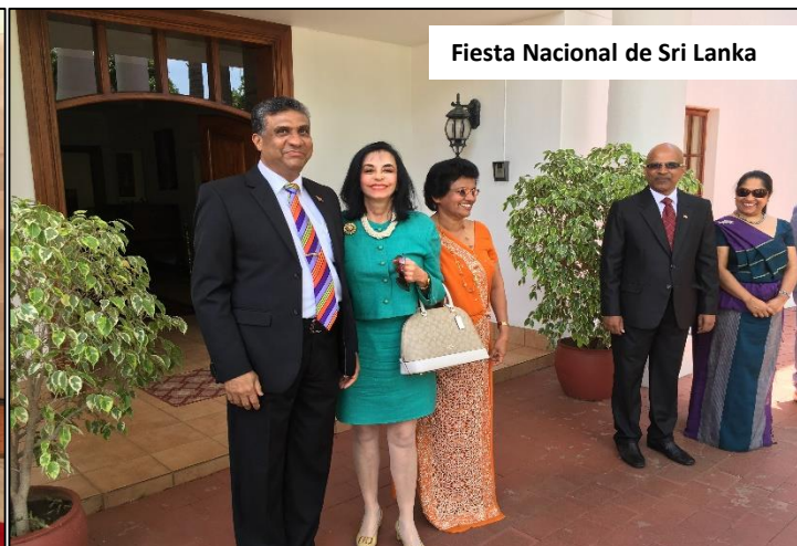
Fiesta Nacional de Sri Lanka