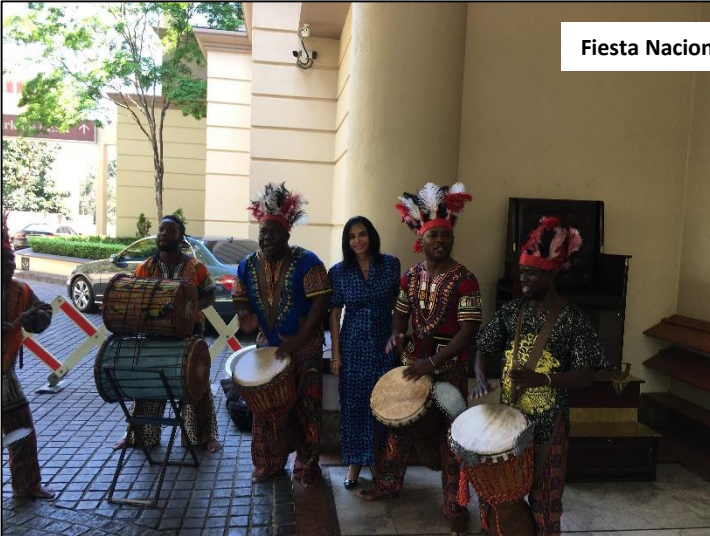
Fiesta Nacional de Ghana