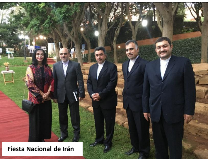
Fiesta Nacional de Irán