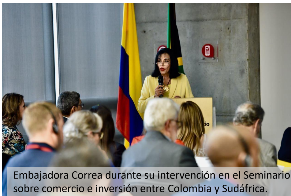
Embajadora Correa durante su intervención en el Seminario sobre comercio e inversión entre Colombia y Sudáfrica.

Bogotá. Un grupo de empresarios y delegados del Gobierno sudafricano estuvieron adelantando una semana llena de actividades en Bogotá, Barranquilla, Cartagena y Santa Marta, con la que se pretendió estimular los contactos comerciales, conocer la capacidad portuaria del país, y la cultura de hacer negocios de los colombianos, adelantar discusiones en asuntos de admisibilidad para productos agrícolas, entre otros temas. En aspectos de cooperación comercial, la Embajada en Sudáfrica ha promovido con la Cámara de Comercio de Bogotá (CCB), la firma de un memorando de entendimiento, en los últimos seis meses, con las Cámara de Comercio e Industria de Randburg, Fourways, del Cabo y la Agencia Oficial de Promoción del Turismo, Comercio e Inversión de Ciudad del Cabo-Wesgro (por sus siglas en inglés).