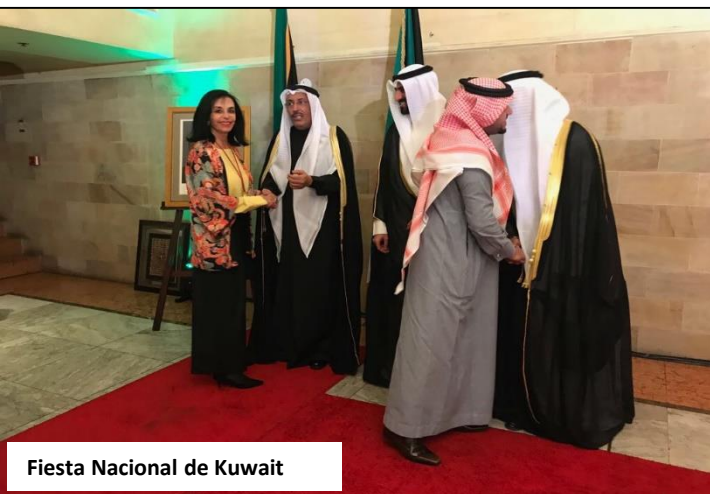
Fiesta Nacional de Kuwait